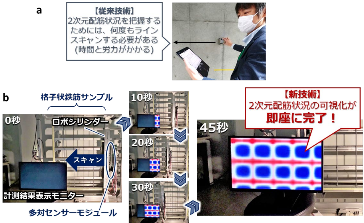
図3 (a)従来の計測手法と、(b)今回開発した2次元スキャナーによる計測の流れ